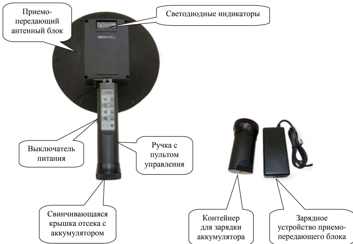
Рис. 1 Внешний вид обнаружителя и его зарядное устройство