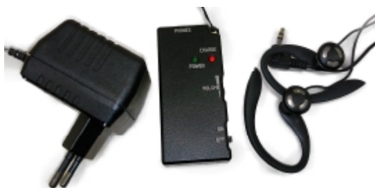
Рис. 2 На рис.2. показаны приемник, сетевой адаптер для зарядки его аккумулятора и наушники.