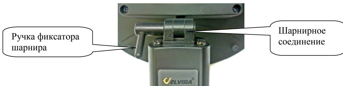
Рис. 4 Шарнирное соединение

4.2. Шарнирное соединение приемно-передающего антенного блока с ручкой (рис. 4) предназначено для перевода блока в транспортное положение и фиксации положение антенны, удобного для проведения, поисковых работ.