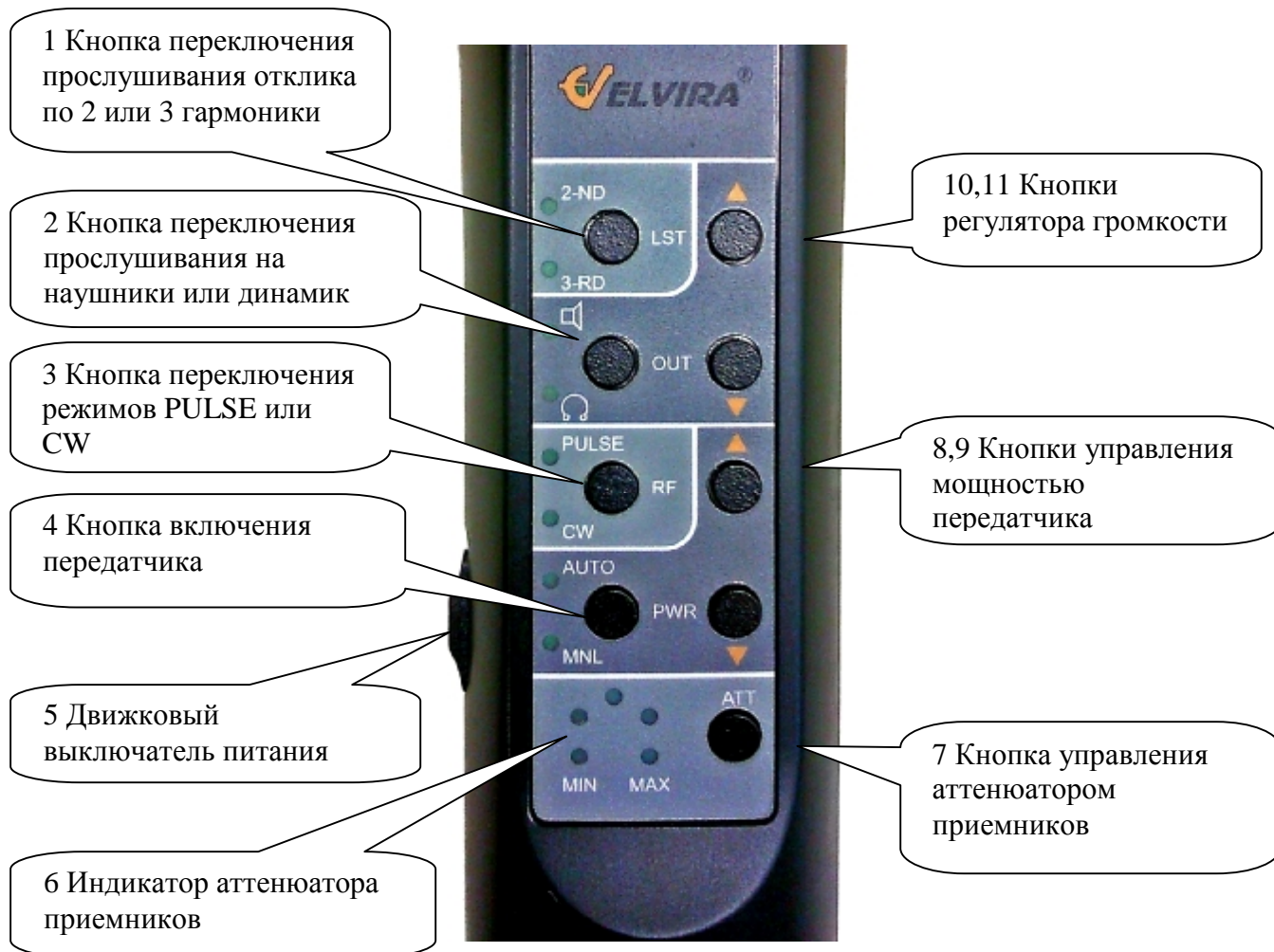
Рис. 5 Пульт управления

4.4. Функции индикаторов пульта управления: Непрерывное свечение любого индикатора соответствует положению «включено», отсутствие свечения – положению «выключено». Одновременное мигание всех индикаторов пульта управления указывает на разряженность аккумуляторной батареи и необходимость ее зарядки.