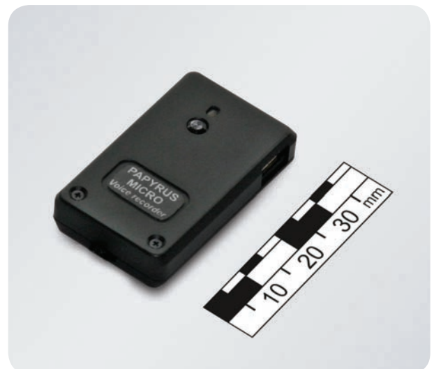
Цифровой диктофон ПАПИРУС-МИКРО в металлическом корпусе