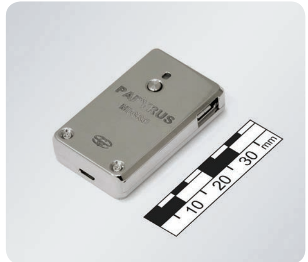
Цифровой диктофон ПАПИРУС-МИКРО ТИТАН (титановый корпус)

В аудиорегистраторе АВТОМОБИЛЬНЫЙ USB АДАПТЕР скорость выгрузки записанной информации в компьютер увеличена.